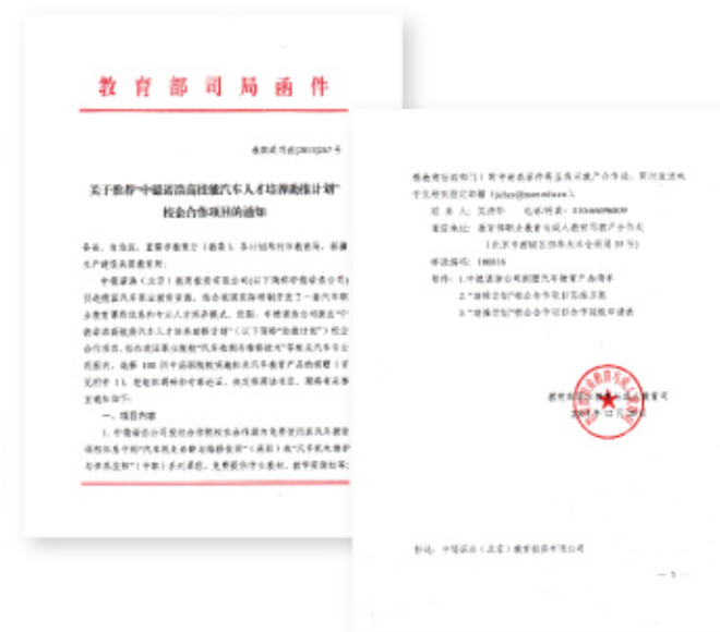
教育部 - 中德诺浩“助推计划”发文

2013 年 12 月，教育部面向全国各省、自治区、直辖市下发了《关于推荐“中德诺浩高技能汽车人才培养助推计划”校企合作项目的通知》(教职成司函字〔2013〕267 号)，要求在未来三年内推荐选拔 100 所职业院校参加“助推计划”，从而助推我国汽车职教课程和人才培养模式的改革创新。