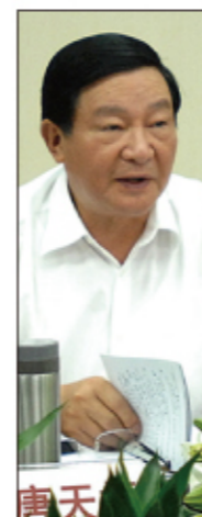
唐天标 名誉主席 上将，曾任 总政治部前副 主任，第 11 届 全国人大科教 文卫委员会副 主任委员