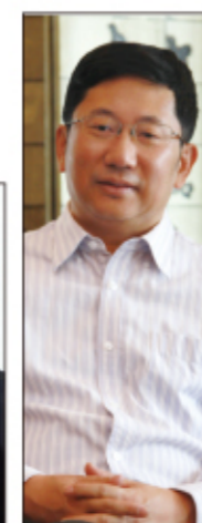
徐井宏 主席 现任清华 控股有限公司 董事长