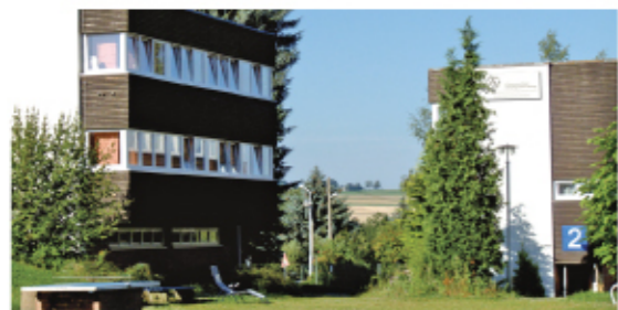
Sachsen gGmbH 德国F+U萨克森职业教育集团

中德诺浩（北京）教育投资有限公司成立于 2003 年，是由清华科技园（后迪控股）与德国 F+U 萨克森职教集团共同投资创办的专业教育服务机构，致力于成为中国领先的世界级职业教育课程的提供商和服务商。