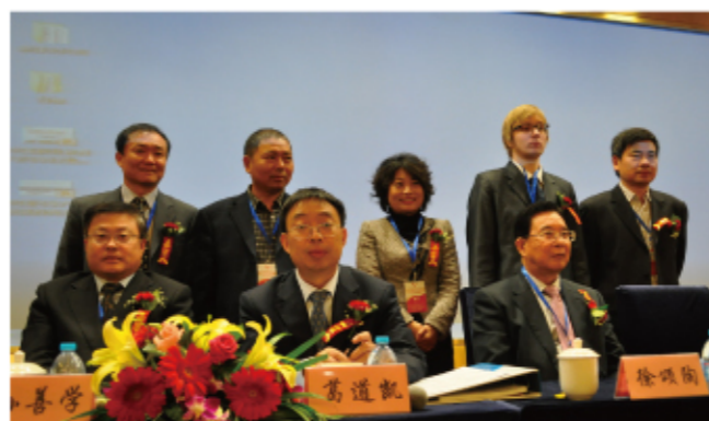
教育部职成司司长葛道凯参加签约仪式