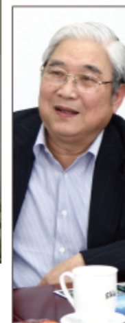
郭孔辉 终身名誉主席 中国工程 院院士，我国汽 车行业著名专 家，现任中国汽 车工业协会副 理事长