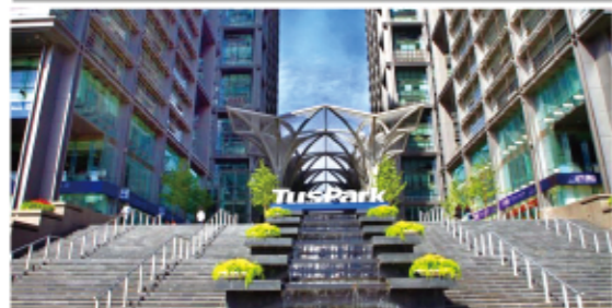
TusPark 清华科技园 (后迪控股)